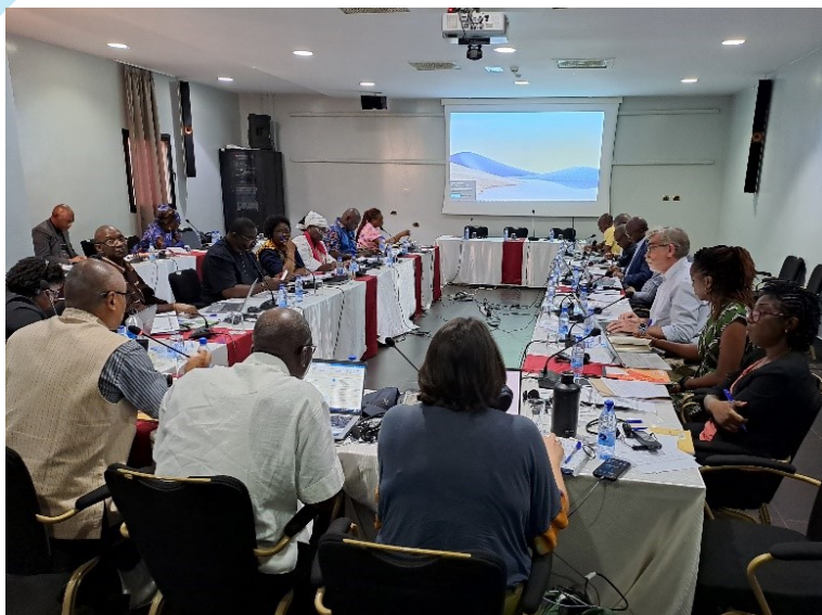
Réunion des partenaires (11 avril 2023)