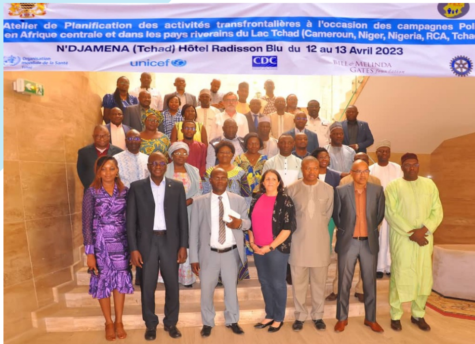
Photo de famille à l'issue de l'ouverture présidée par le Secrétaire Général du Ministère de Santé du Tchad, ayant à ses côtés les partenaires de l'Initiative Mondiale de l'Eradication de la Poliomyélite (OMS, UNICEF, BMGF) et les délégations des Ministères de la Santé et des partenaires pays présents à l'atelier