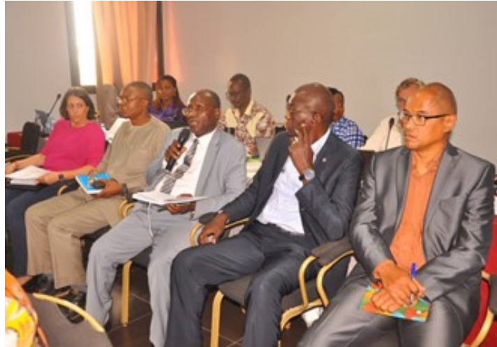
Orientations de M. le Secrétaire Général dans la planification des campagnes